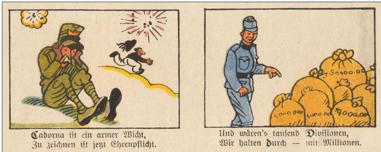
C - Cadorna je ubožák, upisujte je to otázkou cti

V úterý 28. července 1914 vyhlásilo Rakousko-Uhersko Srbsku válku. O den později začalo jeho podunajské loďstvo ostřelovat Bělehrad. Na základě uzavřených dohod začala série událostí, která zatáhla většinu evropských zemí do konfliktu, později nazvaného 1. světová válka. Letos si připomínáme 99. výročí zahájení tohoto konfliktu a přesně za 365 dní si připomeneme sté výročí. Válka znamenala pro každou z bojujících stran nejen obrovské lidské a materiální škody, ale zejména obrovskou potřebu financovat válečné operace. K tomu účelu se otevřela státní pokladna a začalo vydávání válečných půjček. Ani Rakousko-Uhersko nezůstalo pozadu a už 1. listopadu 1914 vydává první z osmi válečných půjček. V průběhu války bylo vydáno nespočet propagačních materiálů, které měly přesvědčit obyvatele, aby podporovaly válečné úsilí a kupovaly válečné dluhopisy. V našich sbírkových fondech máme několik plakátů a tiskovin s těmito podpurnými akcemi a jeden z nich obsahuje abecedu válečných půjček. Na každé písmeno německé abecedy připadá jeden obrázek, kterých je na plakátu celkem 24. Proto dnes zahájíme seriál, ve kterém každý měsíc představíme dva obrázky. Celý rok, až do kulatého výročí, si tak budete moci číst v této abecedě a na konci si sestavit celý plakát.